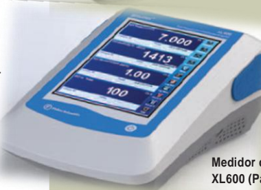
Medidor de Mesa XL600 (Pag 4 y 5)