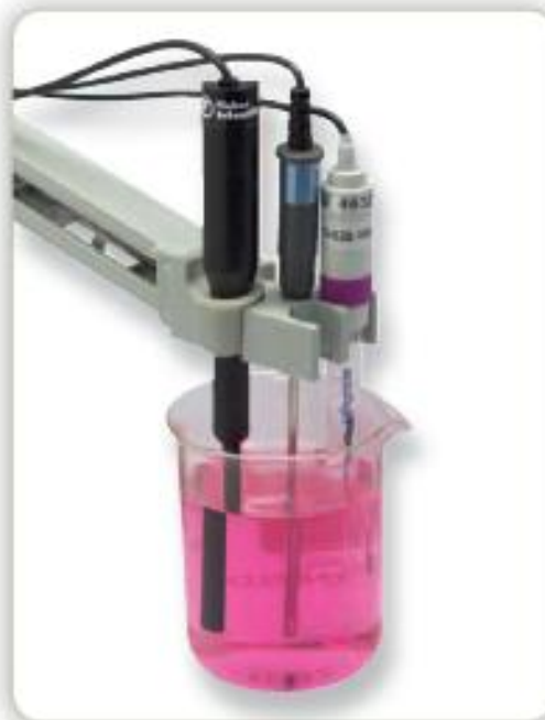
Su diseño delgado permite mezclar sin esfuerzo