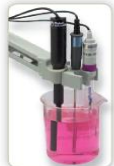
Brazo de electrodo removible puede ser montado en cualquier lado del medidor, o añadir un segundo brazo para facilitar la operación multi-sonda..