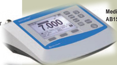
Medidor de Mesa AB15 (pag 11)

Ya sea que usted este midiendo pH, mV (ORP), concentración de Ion selectivo, conductividad, sólidos disueltos totales (TDS), oxígeno disuelto, temperatura, o todo lo anterior, Fisher Scientific Accumet® ha estado ofreciendo los productos que Usted necesita desde 1965. Para obtener más información, póngase en contacto con nuestros representantes de ventas de Fisher Scientific en todo el mundo o visite www.fishersci.com .