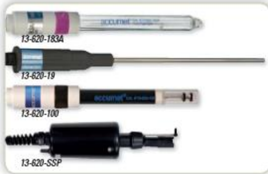
"XL600 Deluxe" kit incluye estos electrodos. Para electrodos de Ion selectivo (ISE), consulte la página 14.